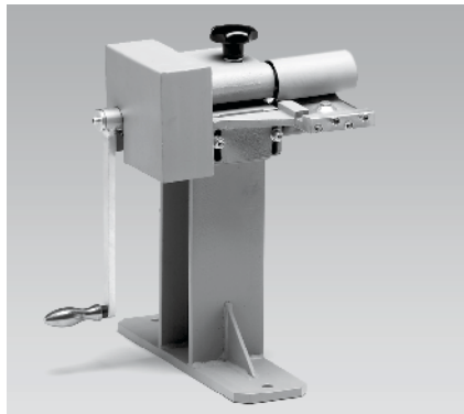
PS-WD-70/V; Keilschälgerät manuell